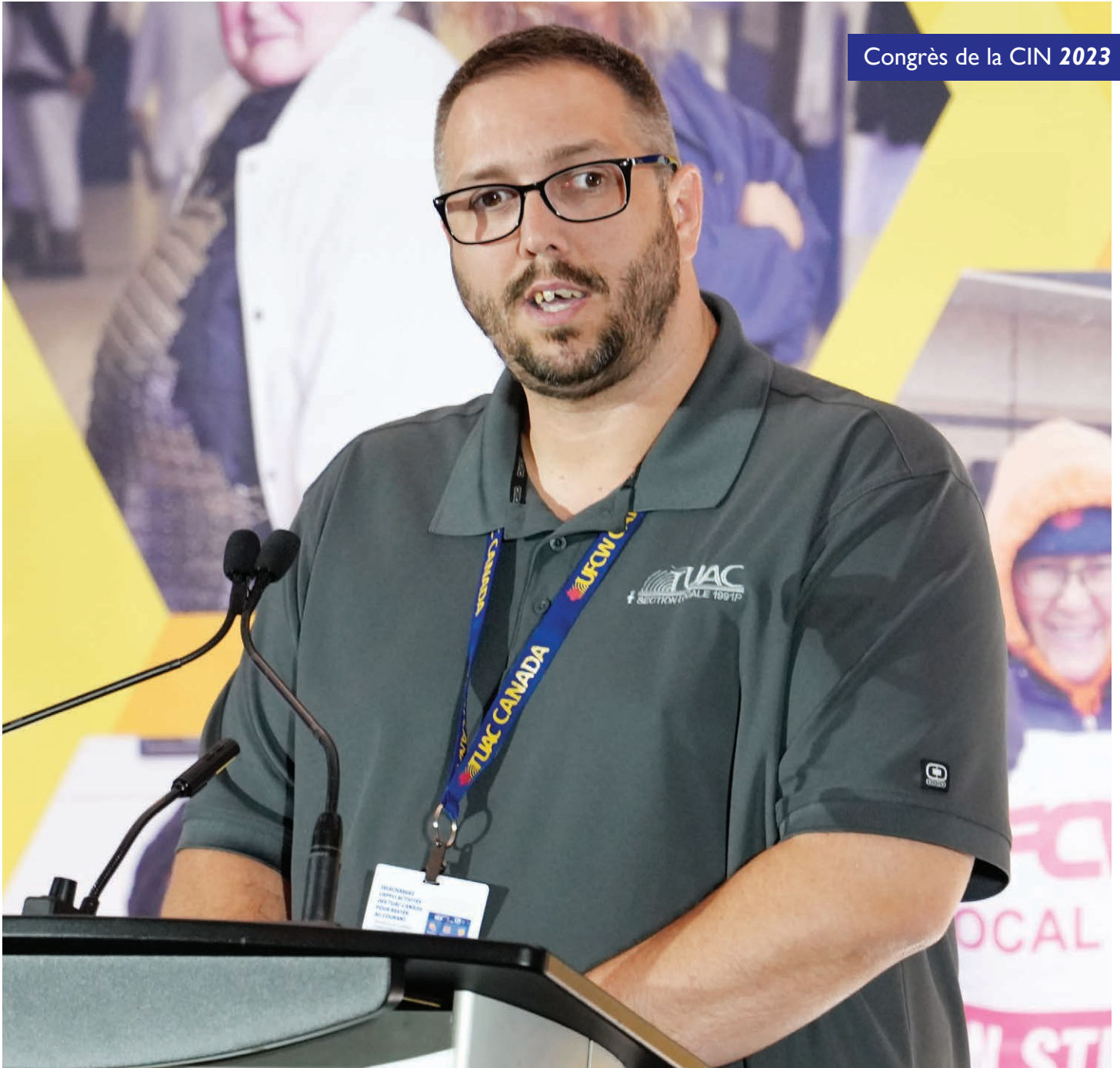
Congrès de la CIN 2023