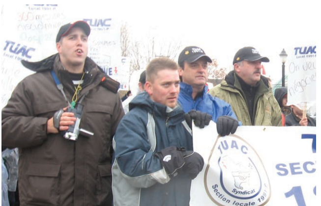
Grève ATrahan 2006