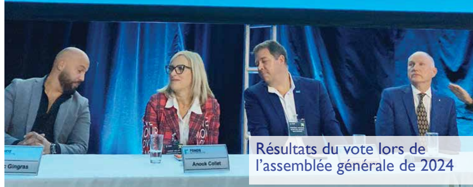
Résultats du vote lors de l'assemblée générale de 2024