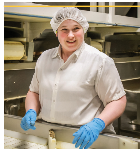
Pour voir l'album photo de notre visite, allez au https://goo.gl/pEYyS9

Notre nourriture est lentement cuite au four en petites portions. Nous nous assurons ainsi de sa qualité et d'en faire ressortir naturellement tous ses arômes et toute sa saveur. Après tout, notre différence est dans la cuisson!