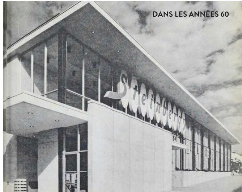
DANS LES ANNÉES 60

LES EMPLOYÉS M'ONT DONNÉ LEUR CONFIANCE, J'AI FAIT CONFIANCE AU SYNDICAT ET ÇA NE M'A PAS DÉÇU. C'EST UN GROS SOULAGEMENT. JE SAIS QUE LE PROCESSUS N'A PAS ÉTÉ FACILE, MAIS PEU À PEU, AVEC LE TRAVAIL D'ÉQUIPE, NOUS Y SOMMES ARRIVÉS.»