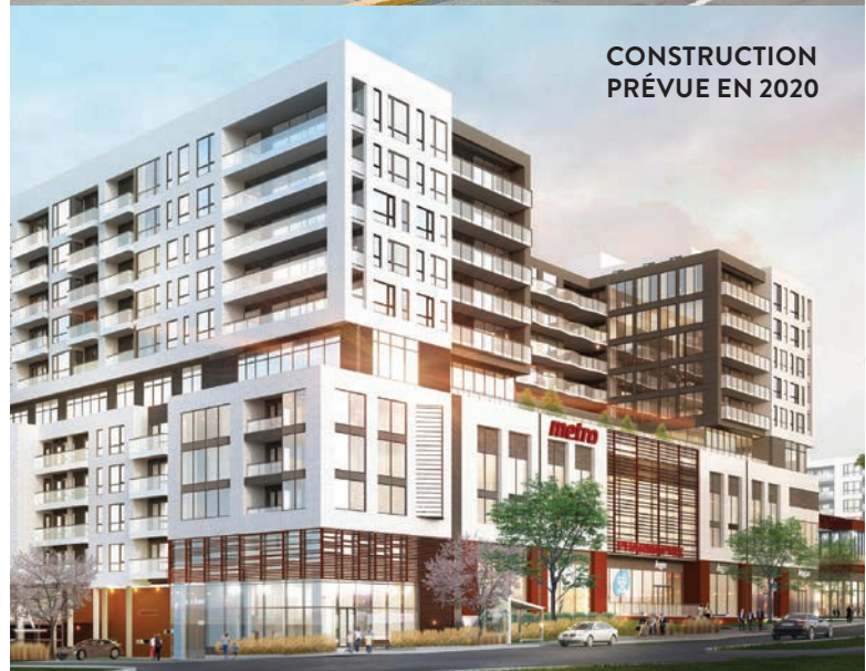
CONSTRUCTION PRÉVUE EN 2020