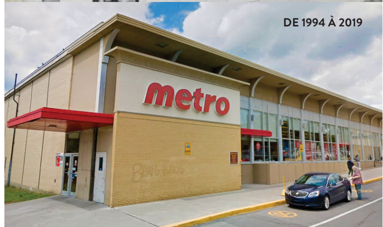
DE 1994 À 2019