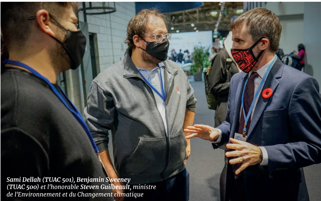
Sami Dellah (TUAC 501), Benjamin Sweeney (TUAC 500) et l'honorable Steven Guilbeault, ministre de l'Environnement et du Changement climatique

POUR EN SAVOIR PLUS SUR LE RÔLE DE LA FTQ À LA COP26 ET LES ENJEUX ENVIRONNEMENTAUX : WWW.FTQ.QC.CA