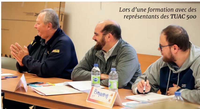
Lors d'une formation avec des représentants des TUAC 500

Dans les années 1980, lors des négociations provinciales de Steinberg