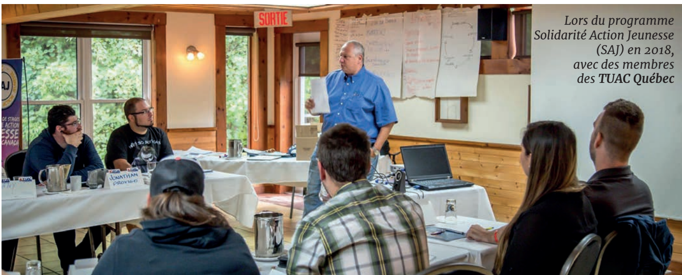
Lors du programme Solidarité Action Jeunesse (SAJ) en 2018, avec des membres des TUAC Québec