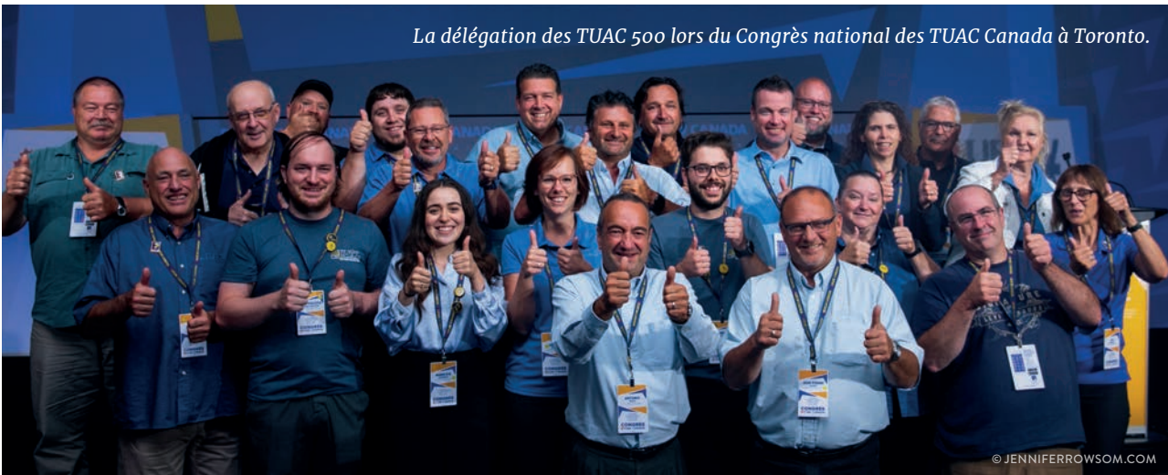
La délégation des TUAC 500 lors du Congrès national des TUAC Canada à Toronto.

d'expertise. Agrémenté par des performances artistiques de danse et de chants, les délégué-e-s ont été transportés dans l'imaginaire autochtone canadien. Finalement, les délégué-e-s ont voté en faveur de 16 résolutions visant à faire avancer des enjeux importants pour l'organisation des TUAC Canada. La table est mise pour la 14 e édition qui aura lieu en 2027.