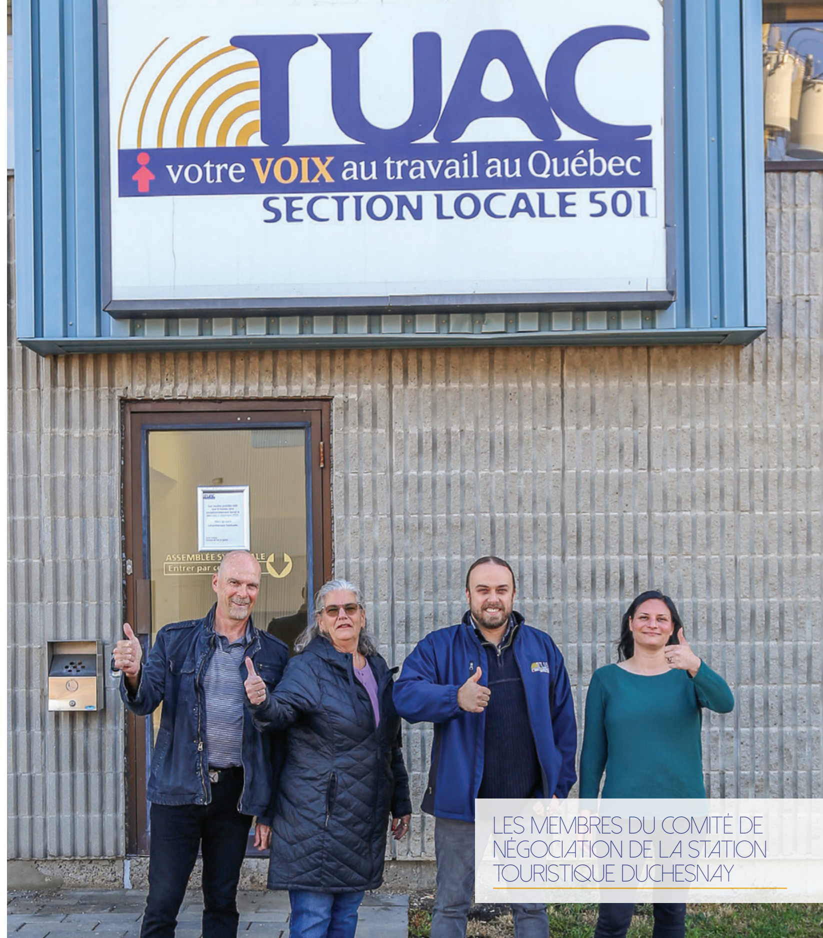
LES MEMBRES DU COMITÉ DE NÉGOCIATION DE LA STATION TOURISTIQUE DUCHESNAY

LES PARTIES SONT PRÉSENTEMENT EN NÉGOCIATION DE LEUR PREMIÈRE CONVENTION COLLECTIVE TUAC!