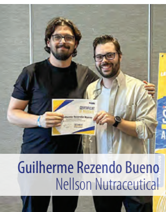
Guilherme Rezendo Bueno Nellson Nutraceutical

Cette année encore, des jeunes militant(e)s des TUAC 501 ont pris part à deux rendez-vous incontournables de la formation syndicale : le camp Solidarité action jeunesse (SAJ) des TUAC Canada et le Camp des jeunes de la FTQ . Ces expériences, à la fois formatrices et humaines, ont permis à la relève syndicale de renforcer ses connaissances, d'approfondir sa réflexion et d'affirmer son engagement envers un mouvement syndical fort, inclusif et solidaire.