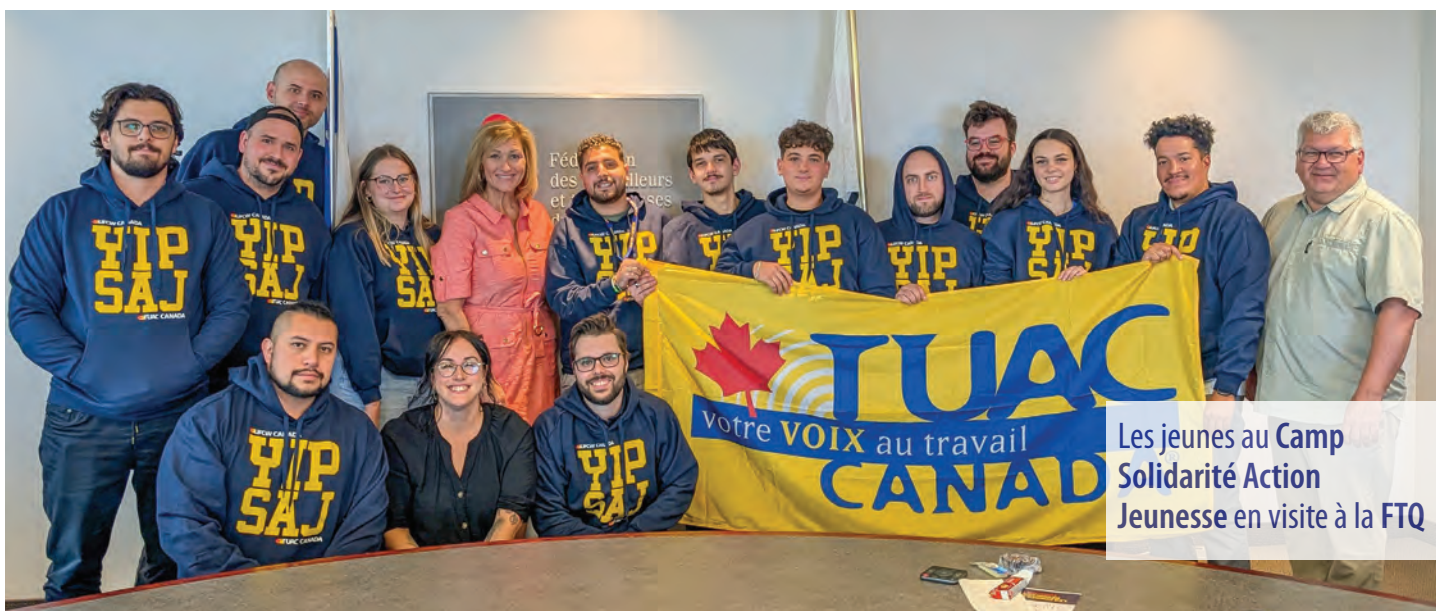
Les jeunes au Camp Solidarité Action Jeunesse en visite à la FTQ

Grâce à des initiatives comme le SAJ et le Camp des jeunes de la FTQ, la flamme syndicale continue de briller entre leurs mains, éclairant l'avenir d'un monde du travail plus juste et plus humain.