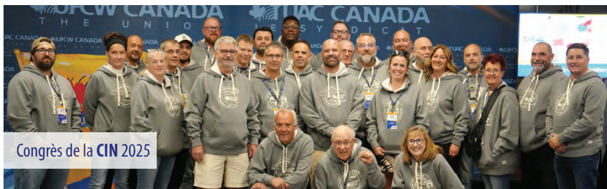
Congrès de la CIN 2025

Les représentant(e)s des TUAC ont été chaleureusement accueillis par la direction et le délégué syndical. Ils ont pu constater le dynamisme des lieux et le rôle central du syndicat dans la défense des conditions de travail et la stabilité des emplois. Ce projet permettra à Olymel de consolider